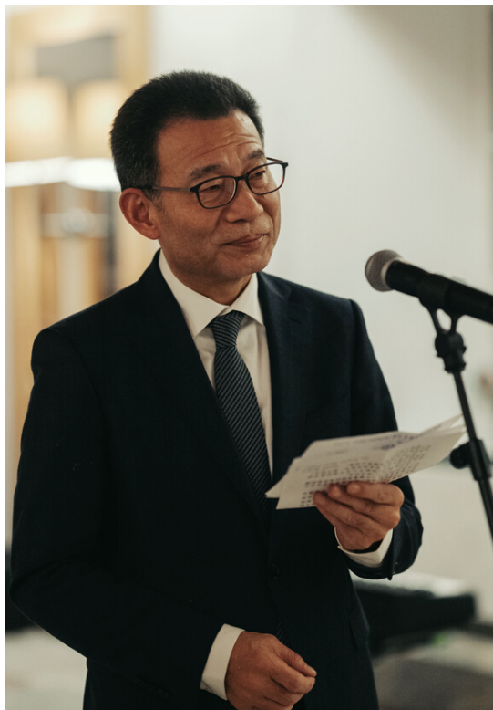
Nagovor Veleposlanika Ljudske republike Kitajske v Ljubljani, nj. eksc. Wanga Shunqinga