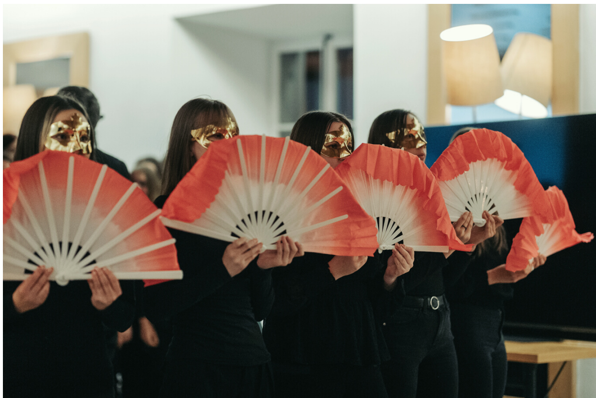
Za kulturne vložke je poskrbel eden izmed sponzorjev dogodka, Konfucijev inštitut Ljubljana