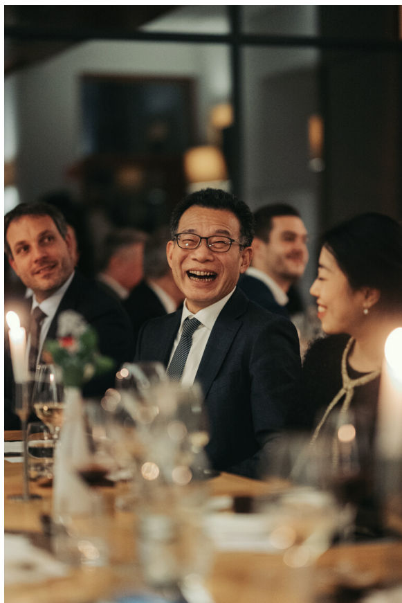
Toplo vzdušje na Letni večerji članov in partnerjev Slovensko-kitajskega poslovnega sveta