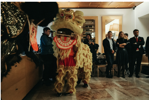
Tradicionalni levji ples